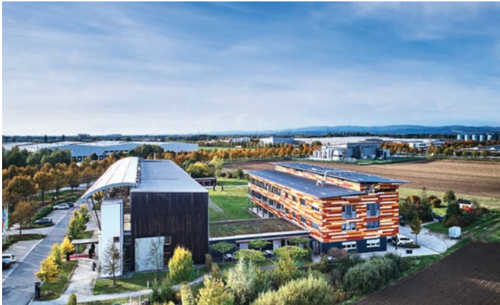
Start-up-Space im BioCubator, Bayerns einzigem Unternehmerzentrum für Nachwachsende Rohstoffe.

Die genauen Termine und Details zum Coaching sowie zur Prämierungsveranstaltung auf www.planb-wettbewerb.de